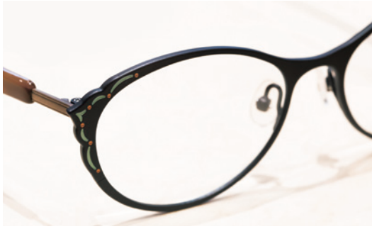
mal 4万8900円(税込) / こちらも新作。フロント端はインド・ムガル建築様式から着想。AKITTOが得意とする柔らかな雰囲気のおーバルシェイプ