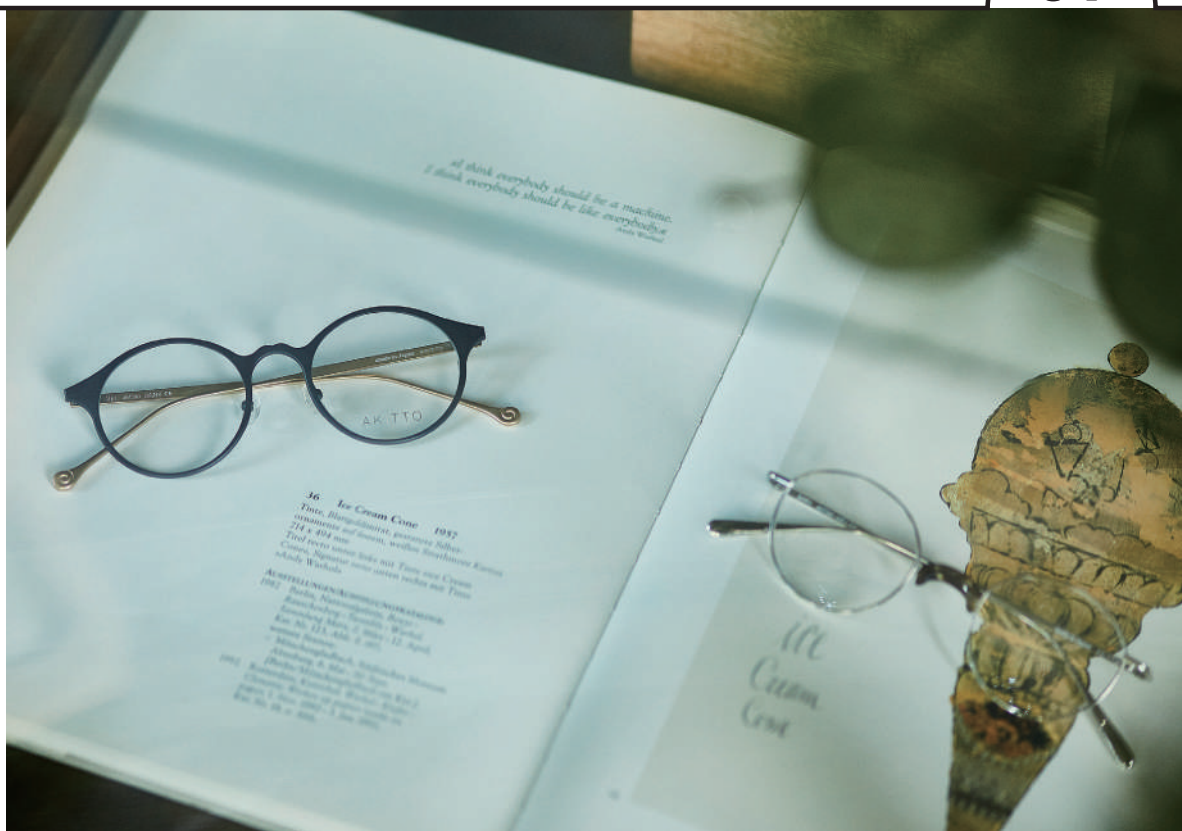
lip1 (リップ ワン) 4万6200円

リップ型のブリッジにさりげなく施された七宝焼のカラーリングがアクセント。猫脚型のテンプルエンドもキュートな1本