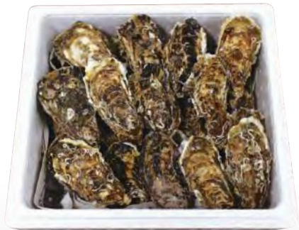
(発泡入り) 3kg入り 2,700円(税込)