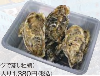
(レンジで蒸し牡蠣) 1kg入り1,380円(税込)

1年物と2年物があるサロマ湖のカキ。大ぶりで食べ応えのある2年物が人気。新鮮だから、生ガキとして食べるのももちろん、酒蒸しやカキ鍋、カキご飯など、自分好みの食べ方で冬の名物を存分に楽しもう。