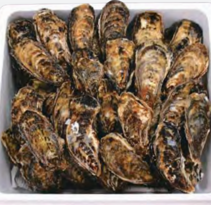
(発泡入り) 5kg入り 4,300円(税込)

海産物の宝庫である、北海道サロマ湖。シマエビ、ホタテがよく知られるところだが、冬季の名産はカキである。サロマ湖の真ガキの水揚げは、10月から2月まで。北勝水産では、サロマ湖沿岸に加工工場を持っていて、高い水準の衛生管理と迅速な作業が可能だ。発送まで新鮮さを保つために、水揚げされたばかりのカキを水槽にいったん戻すという北勝水産独自の工夫もなされている。 冷たいオホーツクの海水と真水とが絶妙に混ざり合う汽水湖のサロマ湖は、カキにとっては最良な成育環境である。餌となるプランクトンが豊富で、たっぷり栄養を蓄えられるので、カキの旨味成分であるグリコーゲンが多く含まれる。今年も例年よりも大ぶりの出来ということだ。身の締まったプリプリの食感、甘く濃厚でクリーミーなカキ料理が家庭で楽しめる。