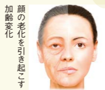
顔の老化を引き起こす加齢変化

料金：【初回トライアル】ジュビダーム1本5万円（税別） 【2回目以降】ジュビダーム1本6万5000円（税別）